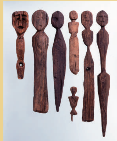
木偶 大中の湖南遺跡(当館蔵) 湯ノ部遺跡・烏丸崎遺跡(滋賀県蔵)