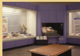
安土城跡の発掘調査