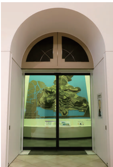
新設された展示室前の自動ドア

さて、今回大きく変わったことと言えば、なんとといっても、展示室の前に自動ドアが新設されたことです。扉が増えただけかと思われるかもしれませんが、実は、文化財を取り扱う施設にとって、扉には大きな意味があるのです。文化財を守り伝えてゆくためには、空間を一定の温湿度に保ち、清潔にしておく必要があります。空間を周囲と切り離す「扉」は、外部の空気やホコリ、虫や菌などの侵入を減らすのに役立ちます。滋賀県の貴重な文化財を守る防具が増えたのだ、とご理解いただけましたら幸いです。 また「扉」は、ここではない場所へ通じる入口でもあります。開いた扉の向こうに広がる展示に、どうぞご期待ください。 (瓜生翠)