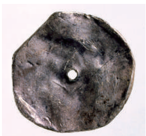
尼子西遺跡出土無文銀銭 (滋賀県蔵)