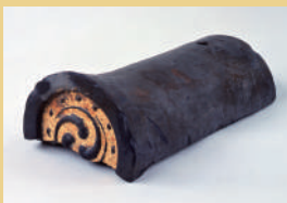
安土城跡出土金箔瓦(滋賀県蔵)