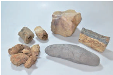
鍛冶関連遺物 (大津市蔵)