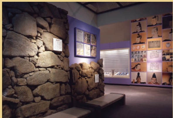
信長の肖像と石垣レプリカ