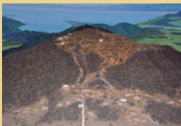
観音寺城地形模型