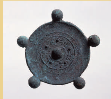
山津照神社古墳出土五鈴鏡(山津照神社蔵)