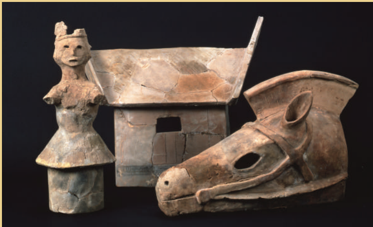
供養塚古墳出土人物埴輪・家形埴輪・馬形埴輪(当館蔵)