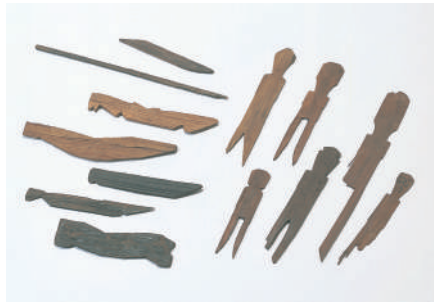
上御殿遺跡出土資料