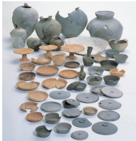
六反田遺跡出土資料