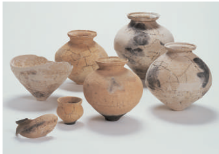
宇佐山古墳群出土資料