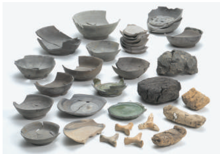
春日北遺跡出土資料