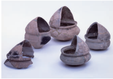
十里遺跡出土資料