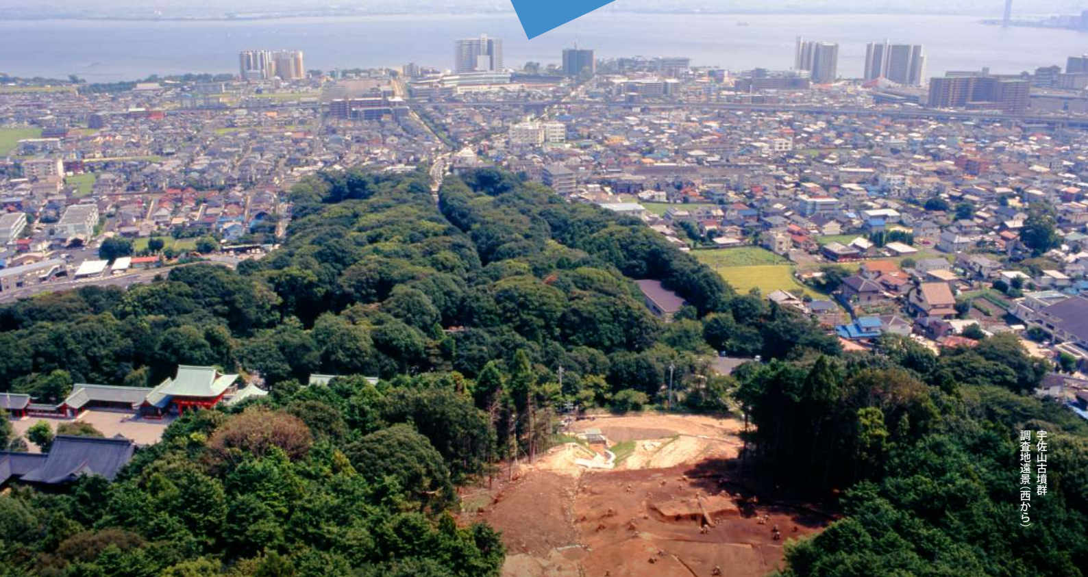
宇佐山古墳群 調査地遠景(西から)

令和4年 7月16日(土) - 9月19日(月・祝) 開館時間 午前9時～午後5時 ※ただし、入館は午後4時30分まで 休館日 7月19日(火)、8月29日(月)、9月5日(月)、9月12日(月) 入館料 大人600円(480円) / 高大生360円(290円) ※小中生・県内高齢者・障害のある方は無料。※( )は20人以上の団体料金です。 信長の館との共通券 大人980円 / 高大生540円