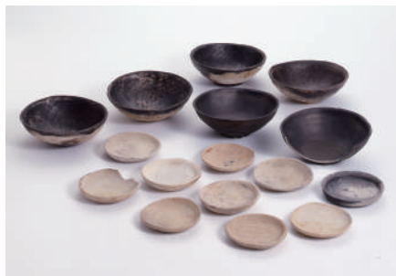
宮前遺跡出土資料