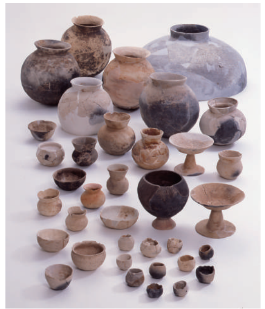
番場遺跡出土資料