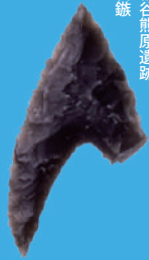
相谷熊原遺跡 石鏃