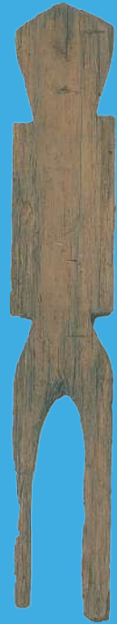
土御殿遺跡 人形代