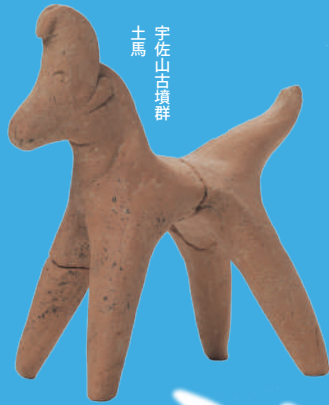
宇佐山古墳群 土馬