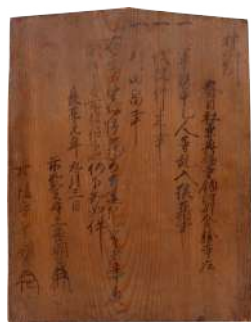
△室町幕府奉行人連署禁制 -金勝寺制札- (栗東市金勝寺蔵)