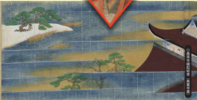
桑実寺秘伝絵巻（桑実寺蔵）