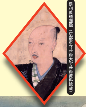
足利義晴画像（京都市芸術大学芸術資料館蔵）