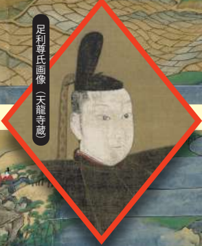
足利義晴画像（天龍寺蔵）