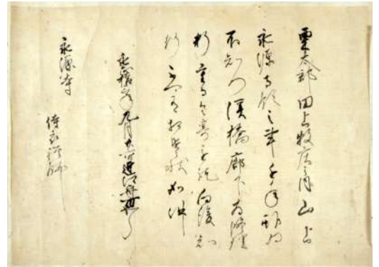
◎六角氏編書下-永源寺文書-(永源寺蔵)