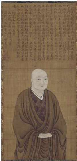
細川高国画像 (東林院蔵)