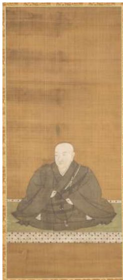
証如画像 (定専坊蔵)