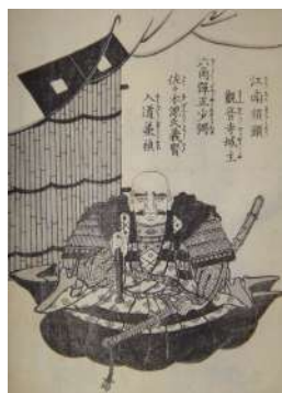
『絵本豊臣勲記』六角承禎 (当館蔵)