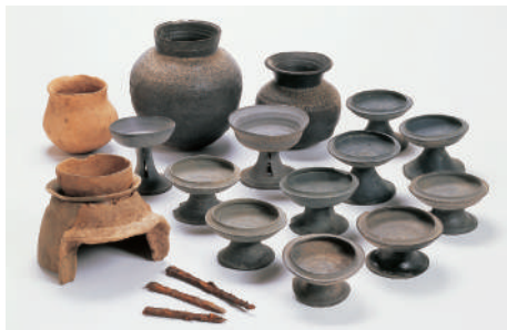
古墳の副葬品 六太銅込古墳13号墳 (滋賀県蔵)

本展では、近年、県内で発掘調査された遺跡の中から、近江の歴史を考える上では欠くことのできない重要な資料であるにもかかわらず、公開される機会が少なかった資料を紹介します。