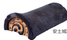
安土城跡出土 金箔瓦 (滋賀県蔵)