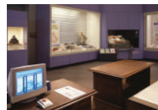
安土城跡の発掘調査