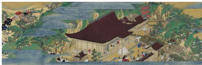
◎ 桑実寺縁起絵巻 (桑実寺蔵) 部分