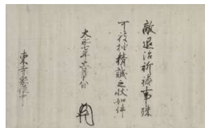
● 足利義晴御判教書 (京都府立京都学・歴史館蔵)