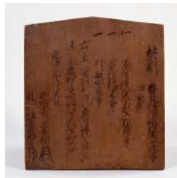
△ 金勝寺制札 (金勝寺蔵)