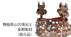
鴨稲荷山古墳出土 金銅製冠 (復元品)