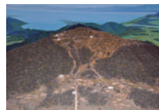
観音寺城地形模型