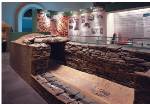
瓢箪山古墳竪穴式石室模型

この展示室では、弥生時代・古墳時代の資料を中心に展示しています。弥生時代の銅鐸や古墳時代の甲冑など、発掘で発見された資料や実物大復元模型がいっぱいです。