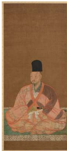
□ 足利義輝画像 (真正極楽寺蔵)

信長上洛から遡る70年ほどの間、六角氏は室町幕府内でも有力な守護大名の一つでした。ある時は將軍親征を受けるほどの軍事力を持ち、ある時は政争で京都を追われた足利將軍を庇護し、京都で覇権を争う三好長慶や管領細川氏と対等に渡り合う政治力を振っていたことは、ほとんど知られていません。展覧会では、この六角氏が輝いていた時代—六角高頼・定頼・義賢の代を取り上げ、知られざる近江の歴史を紹介します。