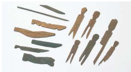
古代の祭祀具 上御殿遺跡 (滋賀県蔵)