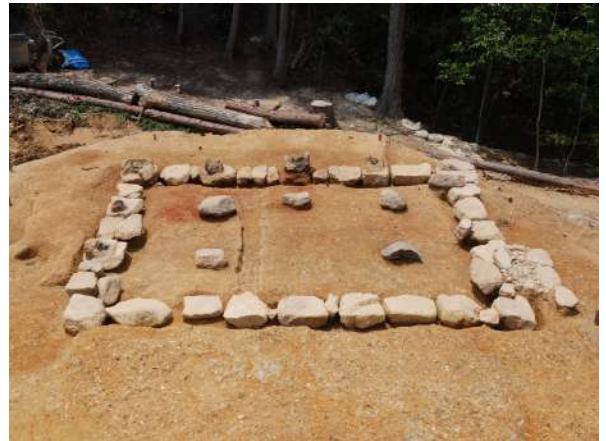
関津城跡 土蔵造建物の地覆石