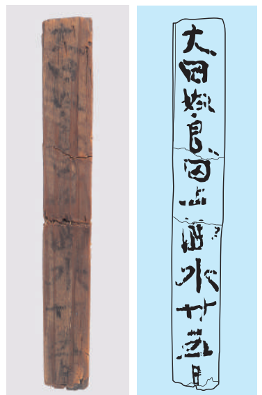
関津遺跡 木簡 (滋賀県蔵)