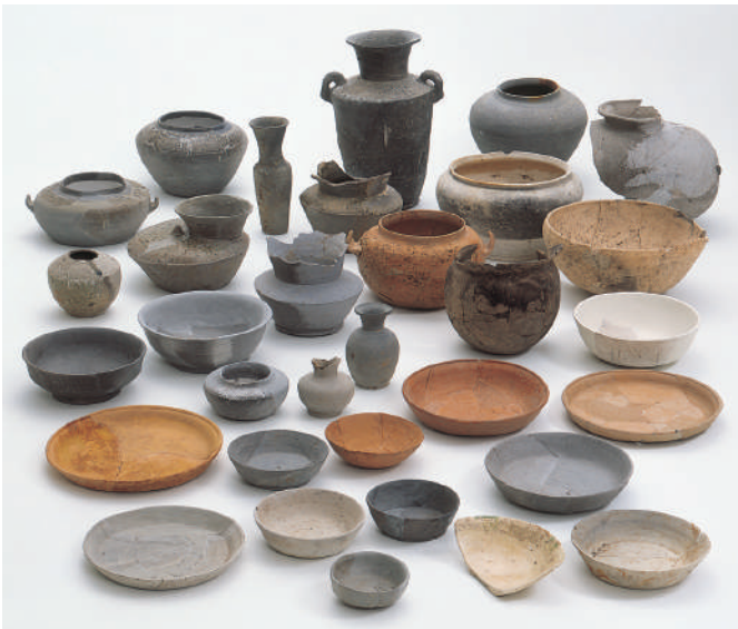
関津遺跡 古代の土器 (滋賀県蔵)