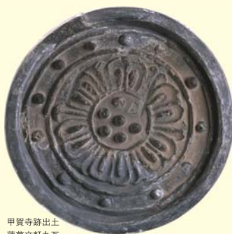
甲賀寺跡出土 蓮華文軒丸瓦