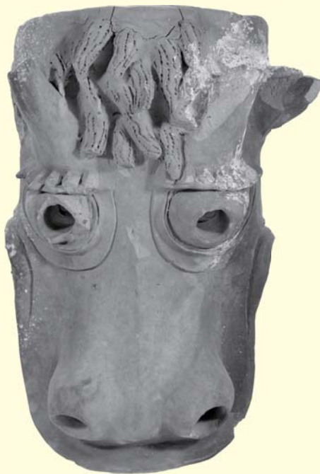
坂本城跡出土 鱗瓦