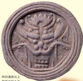
柿田遺跡出土 獣面文軒丸瓦