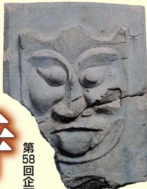
小八木廃寺出土 鬼板