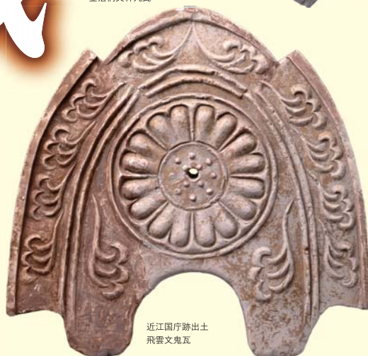
近江国庁跡出土 飛雲文鬼瓦