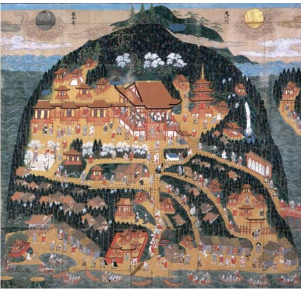
長命寺参詣曼荼羅

この長命寺には、寺院の活動に関わる平安時代以来の古文書が大量に伝わっており、平成二〇年には約五千五百点が滋賀県指定文化財となり、三