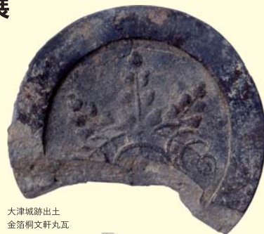
大津城跡出土 金箔桐文軒丸瓦