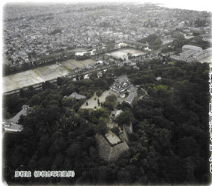
彦根城跡