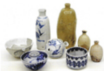
彦根城跡表御殿出土資料 (彦根市教育委員会蔵)