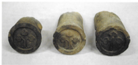
膳所城 軒丸瓦 (大津市歴史博物館蔵)

賀県文化財保護協会、彦根市教育委員会が発掘調査を行った膳所城下町遺跡、彦根城武家屋敷跡や彦根城表御殿跡から出土した資料を中心に、城と城下町の成り立ちとその歩みに、そして城下町に住む人々の暮らしについて紹介いたします。