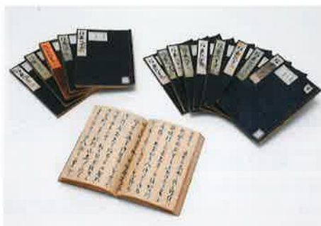
◎信長記(岡山大学附属図書館蔵)

そんな中、どんな時も同盟者として信長の味方となった希有な存在が、徳川家康です。天下静謐のため、都の安寧に腐心する信長にとって、東国への防壁となった家康の存在は、頼もしいものだったはず。それは、信長の死後も続きます。本展では、信長を取り巻く人間模様を「裏切り」をキーワードに紐解きます。