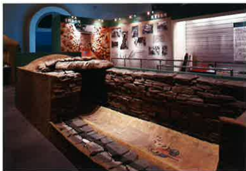
瓢箪山古墳竪穴式石室模型

この展示室では、弥生時代・古墳時代の資料を中心に展示しています。弥生時代の銅鐸や古墳時代の甲冑など、発掘で発見された資料や実物大復元模型がいっぱいです。