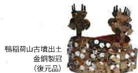
鴨稻山古墳出土 金銅製冠 (復元品)