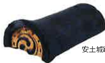
安土城跡出土 金箔瓦 (滋賀県蔵)