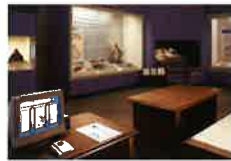
安土城跡の発掘調査