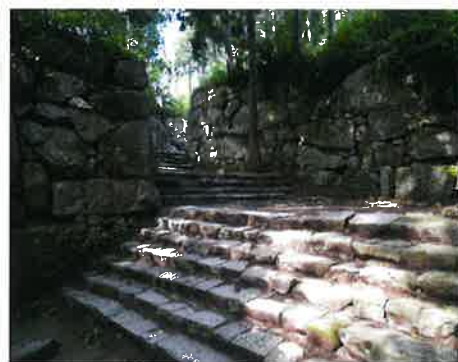
安土城跡 黒金門跡

本展では、近江に築かれた天下人の城の特徴や意義を、発掘調査で出土した資料やパネルで紹介いたします。