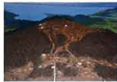
観音寺城地形模型