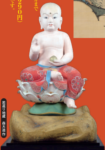
若返り地蔵 森大造作

※必ずマスクを着用してください。発熱・カゼ症状のある方は来館をお断りしております。