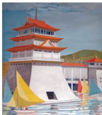
琵琶湖文化館開館ポスター原画