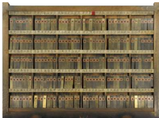
活版印刷資料 (字母)