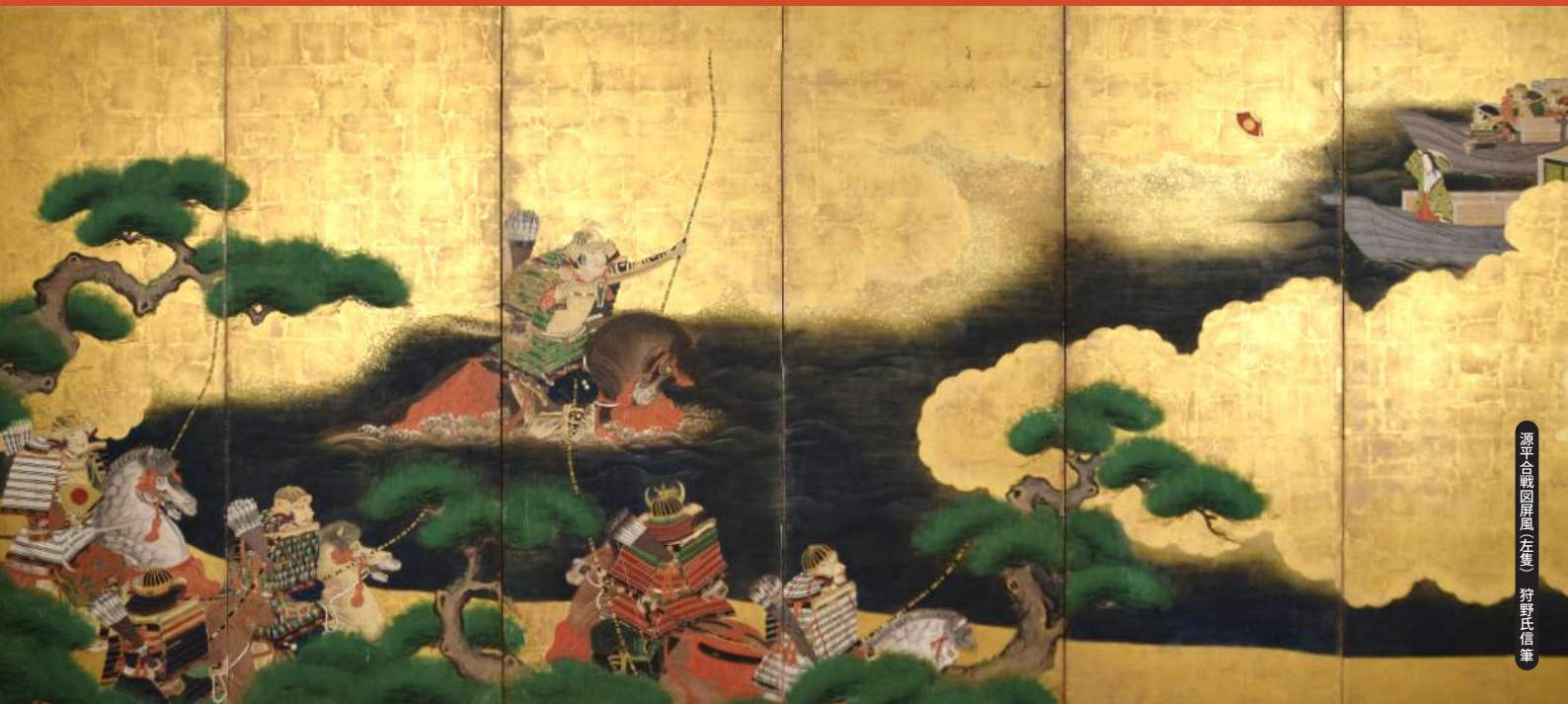
源大龜図(屏風(左半)) 狩野氏信筆

滋賀県立 安土城考古博物館 Shiga Prefectural Azuchi Castle Archaeological Museum