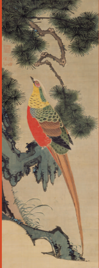
鳥禽図 伊藤若冲筆