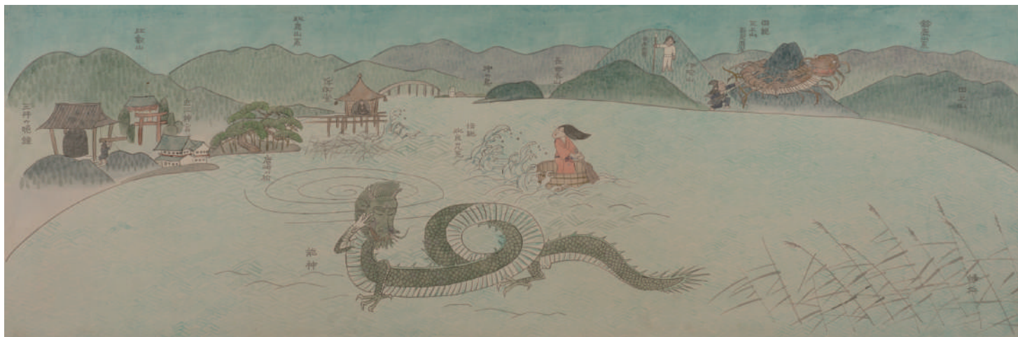
「近江」 鈴木靖将 筆