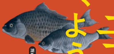
湖魚図(部分) 吉田虎之助筆