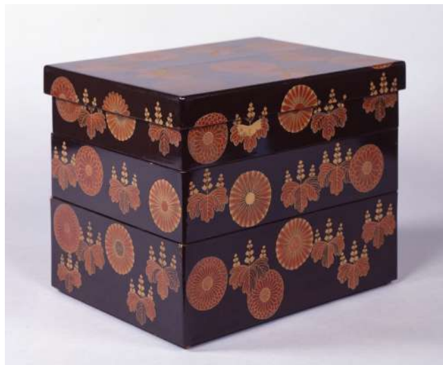
菊桐蒔絵塀重 草津市 観音寺蔵・滋賀県立琵琶湖文化館寄託