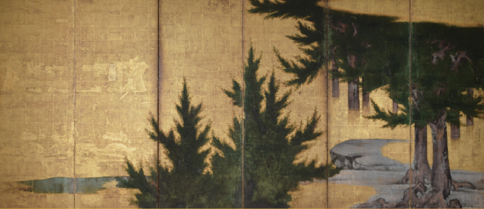
繪図 海北友松筆 滋賀県立琵琶湖文化館蔵

滋賀県立琵琶湖文化館・滋賀県立安土城考古博物館連携企画展 滋賀県立安土城考古博物館 第61回企画展