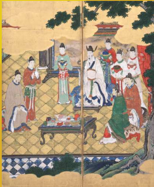
草津市指定文化財 王会図屏風(部分) 草津市 観音寺蔵・滋賀県立琵琶湖文化館寄託