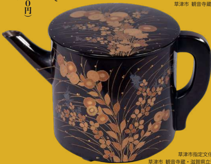
草津市指定文化財 秋草蒔絵湯桶 草津市 観音寺蔵・滋賀県立琵琶湖文化館寄託