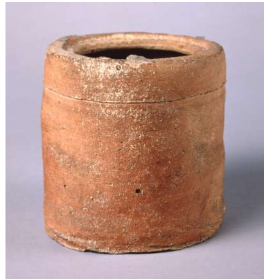
滋賀県指定文化財 信楽 矢筈口水指 滋賀県立琵琶湖文化館蔵

本展覧会で、安土・桃山時代の近江について一層の興味を寄せていただければ幸いです。