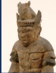
木造牛頭天王坐像 大阪・高向神社