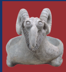
羊形硯 奈良文化財研究所