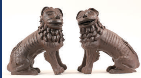
瓦造狛犬 京都・高倉神社