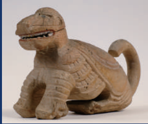
木造狛犬 富山・白山宮