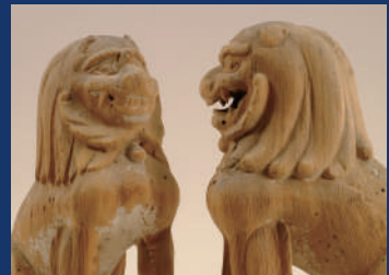
木造狛犬 滋賀・比伎多理神社