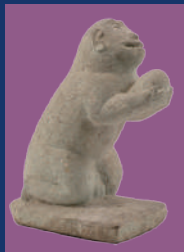
石造神猿 滋賀・須賀神社