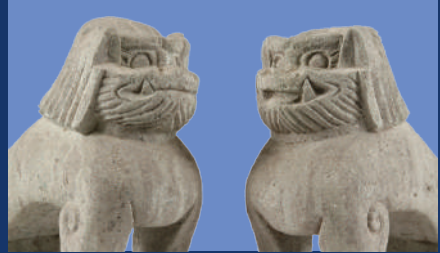
石造狛犬 滋賀・湯次神社