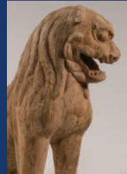
木造狛犬 滋賀・神田神社