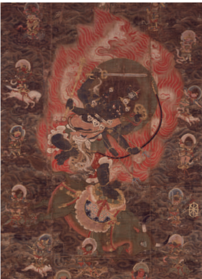
大威徳転法輪曼荼羅図(部分) 個人蔵