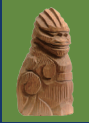
木造狛犬(円空作) 愛知・長福寺