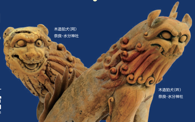
木造狛犬(阿) 奈良・水分神社

近江風土記の丘 滋賀県立 安土城考古博物館 Shiga Prefectural Azuchi Castle Archaeological Museum