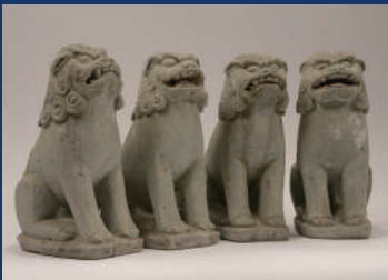
石造狛犬 滋賀・樹下神社