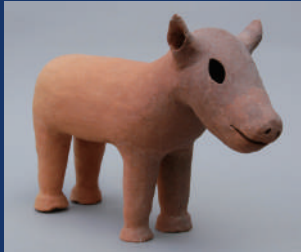
子馬形埴輪 大阪・四條畷市教育委員会