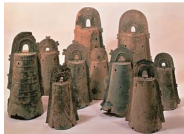
大岩山遺跡出土銅鐸

從距今5000年前的繩文時代的貝塚出土品到大中的湖南遺跡挖掘出的木製農具類以及野洲市大岩山遺跡挖掘出的銅鐸等彌生時代(B.C.800~A.D.250)的遺物在這裡被展示。