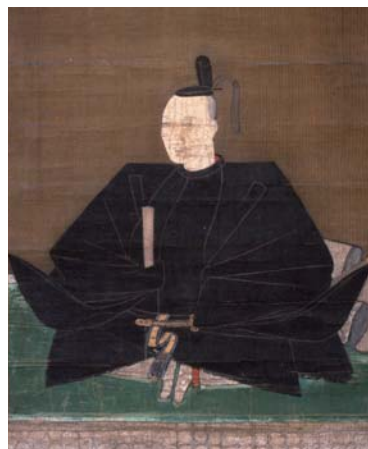
織田信長畫像(摺見寺藏品)