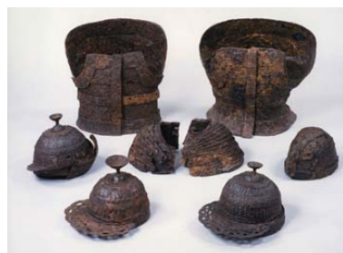
新開古墳出土鐵製甲冑