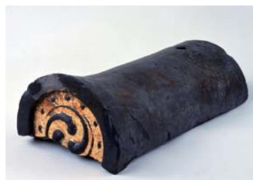
安土城跡出土的金箔瓷磚(滋賀縣教育委員會藏品)