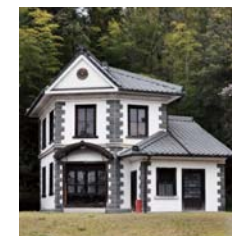
舊安土巡查駐在所