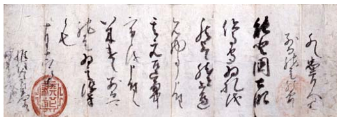
織田信長朱紅印章(私人藏品)