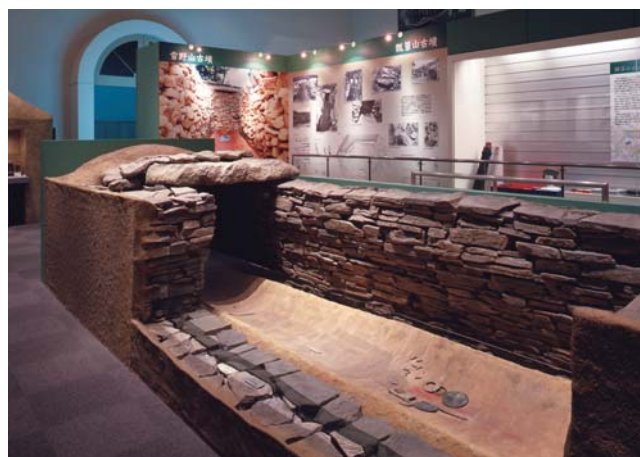
瓢箪山古墳豎穴式石室復元模型(實物大)