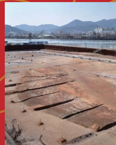
粟津遺跡在琵琶湖底出土的貝塚