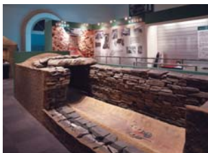
瓢箪山古墳豎穴式石室復元模型(實物大)

瓢箪山古墳是4世紀利用在織山西邊山麓的小山脊建造而成的前方後圓墳墓。全長有136公尺,是滋賀縣內最大的墳墓。在墳墓的頂部建有三個豎穴式石室,在那裡挖掘出了銅鏡及鐵製武器等。