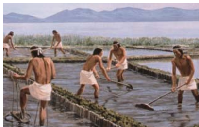
彌生時期農業工作的一個視角

青銅製及鐵製的道具也在彌生時代開始被使用。銅鐸是在彌生時代被製造出的釣鐘型青銅器。雖然它原始的形體被推定位在朝鮮半島,但是在日本列島獨自發達。銅鐸是祭祀用的樂器。內側為青銅及木頭,而或石頭製成的「舌」用繩子吊著,軀幹部分搖晃「舌」,與內面接觸發出聲響。目前為止在日本列島被挖掘出的銅鐸約有500個。明治14年(西元1881年)在滋賀縣野洲市挖掘出14口,昭和37年(西元1962年)挖掘出10口。1881年挖掘出的銅鐸之一被收藏在東京國立博物館,高約135公分,是日本最大的銅鐸。