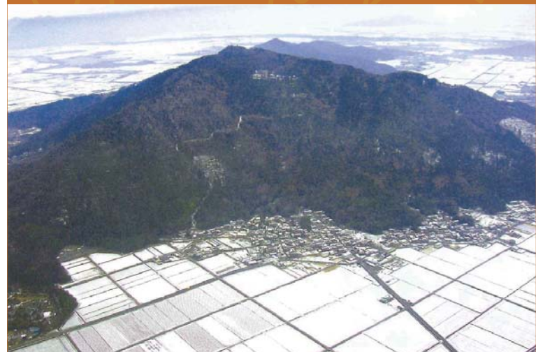
從天空看到的觀音寺城跡

觀音寺城是在標高432公尺的織山被建造的城。城主佐佐木六角氏在鎌倉時代到戰國時代（12世紀末～16世紀）擔任守護的工作而在戰國時代所居住的城即是觀音寺城。作為中世紀的山城遺跡，這座城擁有很龐大的規模。雖然已比安土城早先用大量石塊做成石階而聞名，但石塊被利用及整備的時間約在1530年～60年之間。