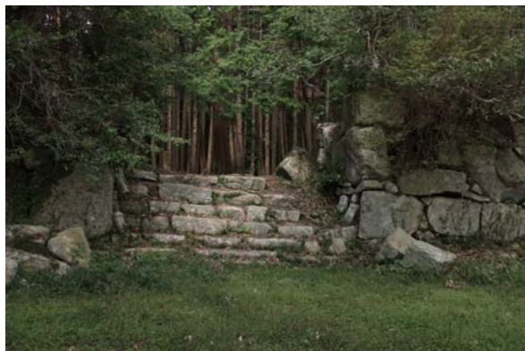
傳平井丸的入口部分

觀音寺城這城名是以城跡中心附近觀音正寺（在中世紀的名稱是觀音寺）為由來。在南北朝時代（14世紀）的書『太平記』裡首次發現「觀音寺ノ城郭」被記載。城的範圍從山頂的南斜面延伸整個山腰，但這些很多被認為是觀音正寺的遺跡，如何區別觀音正寺與觀音寺城的遺跡也將成為今後的課題。