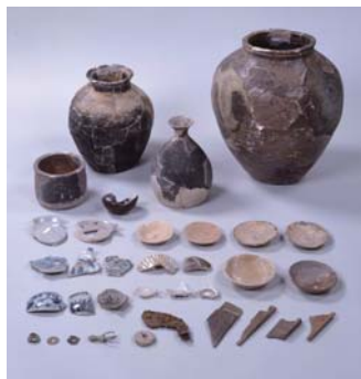
觀音寺城跡的挖掘陶器等 (滋賀縣安土城考古博物館藏品)

永祿11年（西元1568年），織田信長攻擊觀音寺城，城主六角承禎・義治親子輕易地開城投降並逃亡。天正7年（西元1579年）隨著織田信長完建安土城，觀音寺城的歷史告一段落。