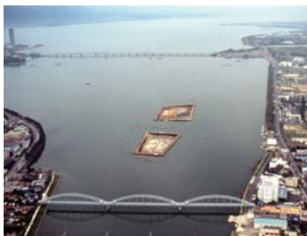
空から見た粟津湖底遺跡

縄文人たちは、貝(ほとんどが淡水種)を食べた後、付近に貝殻を捨てました。その結果として、大規模な貝塚が形作られていきました。貝塚からは、貝殻のほかにも動物や魚の骨、植物遺体、土器など多くのものが発見されています。人工遺物としては、耳飾り、ナイフ、網の錘などさまざまな道具類が出土しています。粟津貝塚から出土した動物遺体や植物遺体は、当時の人々が何を食べて、どのような暮らしをしていたのかについて知るための貴重な資料です。