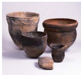
粟津湖底遺跡で出土した土器と石器