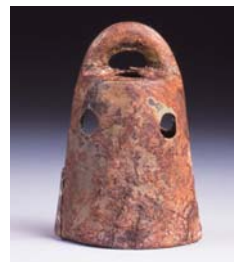
下釣遺跡(栗東市)出土小銅鐸