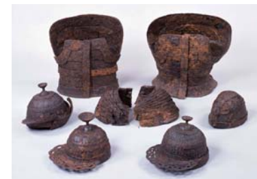
新開古墳出土鉄製武具