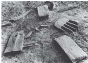
大中の湖南遺跡(近江八幡市)で出土した木製農具

大中の湖を干拓する工事の際に発見された弥生時代の農耕集落の遺跡です。遺跡からは、水田跡や水路跡のほか、稲作に使われた様々な木製農具などが多数出土しました。