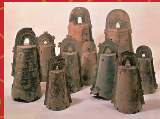
昭和37年に大岩山遺跡(野洲市)で出土した銅鐃群