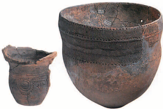
縄文土器（じょうもんどき）