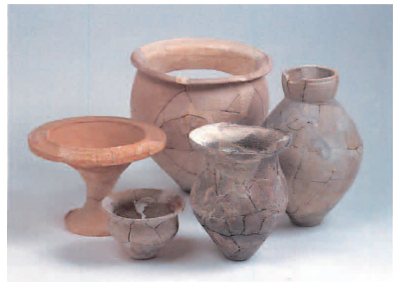
弥生土器（やよいどき）

ぎもん 疑問は、 はくぶつかん 博物館に い 行って き 聞いてみよう！ てがみ お手紙・FAXでもOK！