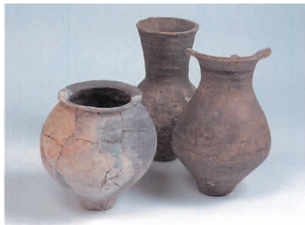
弥生土器 (やよいどき)

ちょうり用の「かめ」や、ほぞん用の「つ ぼ」、一本のあしがついた、もりつけ用の「た かつき」などがみられます。使う目的により、 さまざまな形がありました。