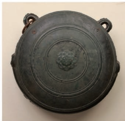
△ 平信長銘髷口(郡上市大師講蔵)