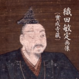
織田敏定画像 (貴成寺蔵)