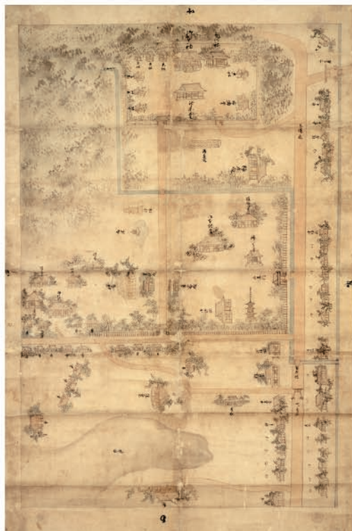
△ 観大明神境内古絵図(越前町観神社蔵)