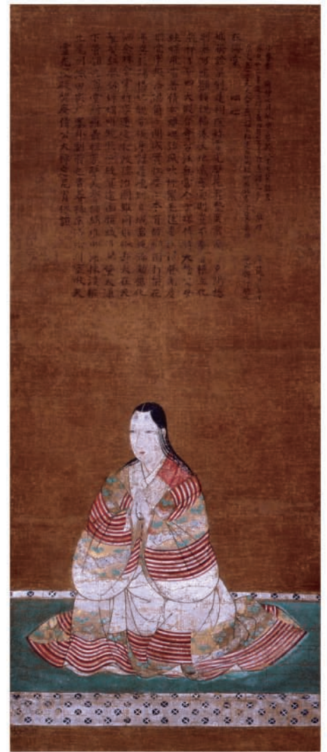
□ 細川昭元夫人一信長妹一画像(京都市龍安寺蔵)