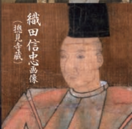
織田信忠画像 (摠見寺蔵)