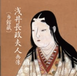
浅井長政夫人画像 (当館蔵)