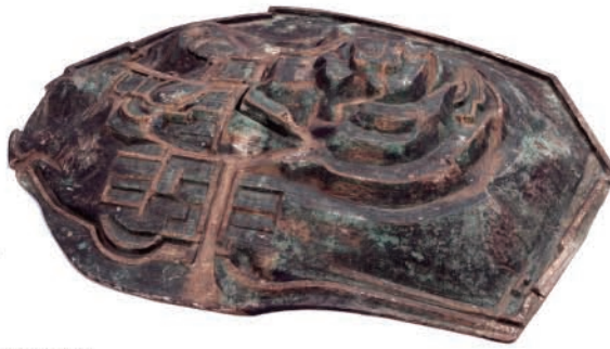
小牧山地形模型(個人蔵)