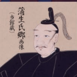
蒲生氏郷画像 (当館蔵)