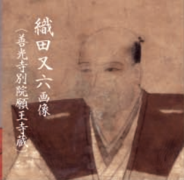
織田又六画像 (善光寺別院願王寺蔵)