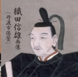
織田信雄画像 (丹波市保管)