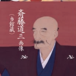
斎藤道三画像 (当館蔵)