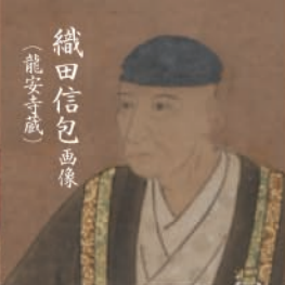
織田信包画像 (龍安寺蔵)