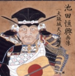
池田恒興画像