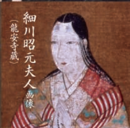
細川昭元夫人画像 (龍安寺蔵)