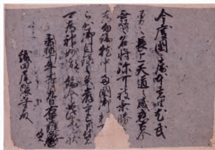
正親町天皇繪旨案(京都市歴史資料館蔵)