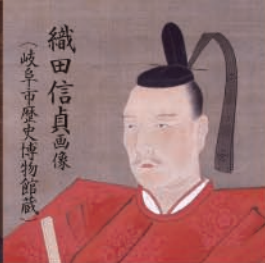
織田信貞画像 (岐阜市歴史博物館蔵)